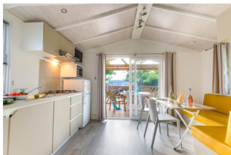
Mobile home Loggia 25 m 2 + terrasse 11 m 2

1 ch. avec 1 lit 140 x 190 1 ch. avec 2 lits 80 x 190 Cuisine équipée Salle de douche, WC séparé Terrasse couverte avec table et fauteuils