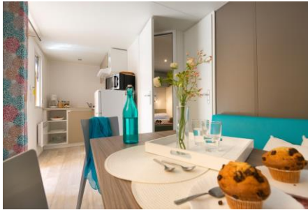
Mobil home Midi 18 m 2 + terrasse 10 m 2

Location SANS EAU (douches, WC, bacs à vaisselle aux sanitaires)