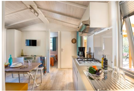
Mobile home Grand Alizé 26 m 2 + terrasse 10 m 2

1 ch. avec 1 lit 140 x 190 1 ch. avec 2 lits 80 x 190 Cuisine équipée Salle de douche, WC séparé Terrasse couverte avec table et fauteuils