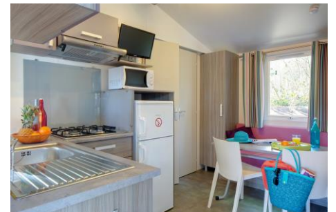
Mobile home Alizé 24 m 2 + terrasse 10 m 2

1 chambre avec 1 lit 140 x 190 1 salon avec couchage 1 pers. Cuisine équipée Salle de douche avec WC Terrasse couverte avec table et fauteuils