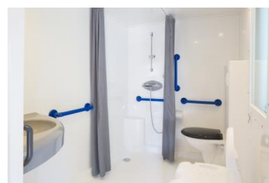
Mobile home Hélios 32 m 2 + terrasse 12 m 2

1 ch. avec 1 lit 160 x 200 1 ch. avec 2 lits 80 x 200 1 ch. avec 2 lits superposés 80 x 200 Cuisine équipée avec lave-vaisselle Salle de douche, WC séparé Terrasse couverte avec table et fauteuils