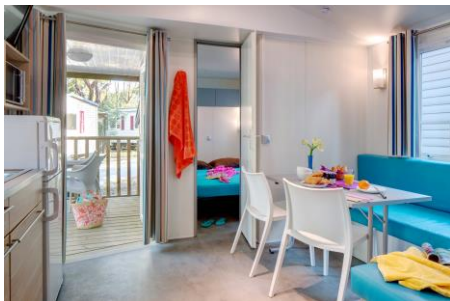
Mobile Riviera 26 m 2 + terrasse 7 m 2

1 ch. avec 1 lit 160 x 200 1 ch. avec 2 lits 80 x 190 Cuisine équipée Salle de douche, WC séparé Terrasse couverte avec table et fauteuils