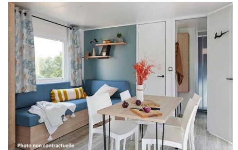
Mobile home Estérel 26 m 2 + terrasse 10 m 2

1 ch. avec 1 lit 160 x 200 1 ch. avec 2 lits 80 x 190 Cuisine équipée Salle de douche, WC séparé Terrasse couverte avec table et fauteuils