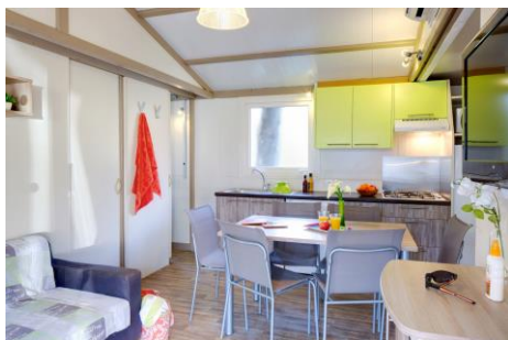
Chalet Pacific 33 m 2 + terrasse 10 m 2

1 ch. avec 1 lit 140 x 190 1 ch. avec 2 lits superposés + 1 lit simple 80 x 190 1 salon avec couchage 1 pers. Cuisine équipée Salle de douche, WC séparé Terrasse couverte avec brise-vues, table et fauteuils