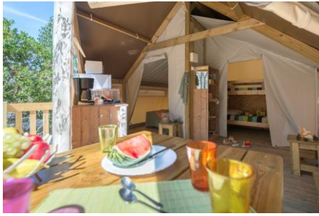
Cabane Toilée 17 m 2 + terrasse 8 m 2