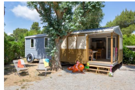
Mobile home Soléo 31 m 2 + terrasse 8 m 2

1 ch. avec 1 lit 160 x 200 1 ch. avec 2 lits 80 x 190 + 1 lit superposé 80 x 190 (max 40 kg) Cuisine équipée avec lave-vaisselle Salle de douche, WC séparé Terrasse couverte avec table et fauteuils